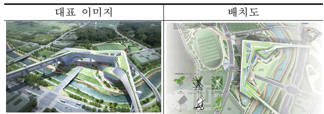
표3. S청사 건축현황