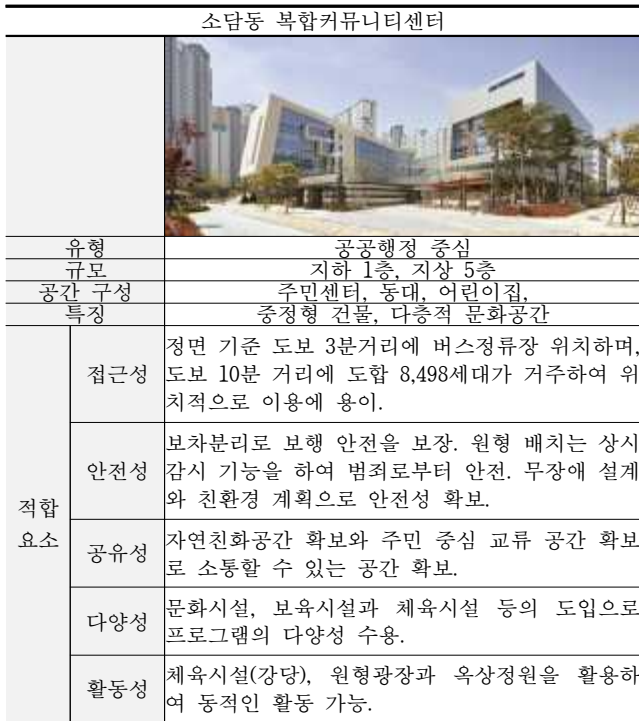
표 6 소담동 복합커뮤니티센터

<표6>에서 보는 바와 같이 소담동 복합커뮤니티센터는 소통과 공존의 장으로 주민 모두가 여유롭게 즐긴다는 이념으로 계획되었다.